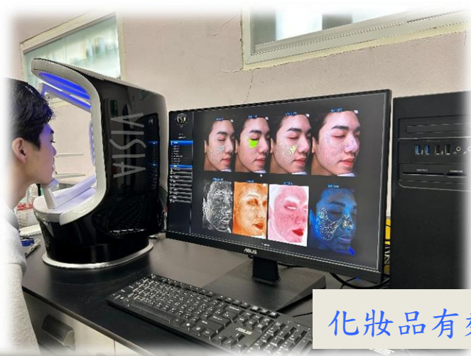
化妝品有效性評估