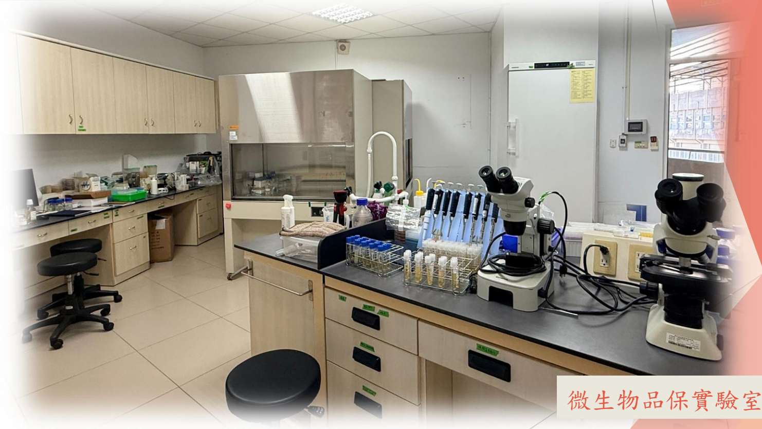
微生物品保實驗室