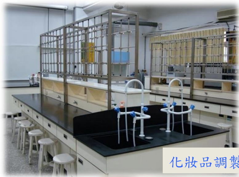
化妝品調製實驗室