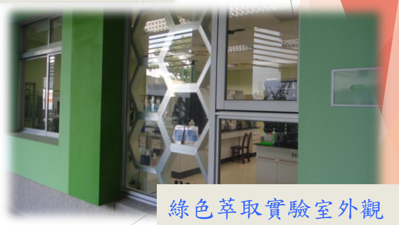
綠色萃取實驗室外觀