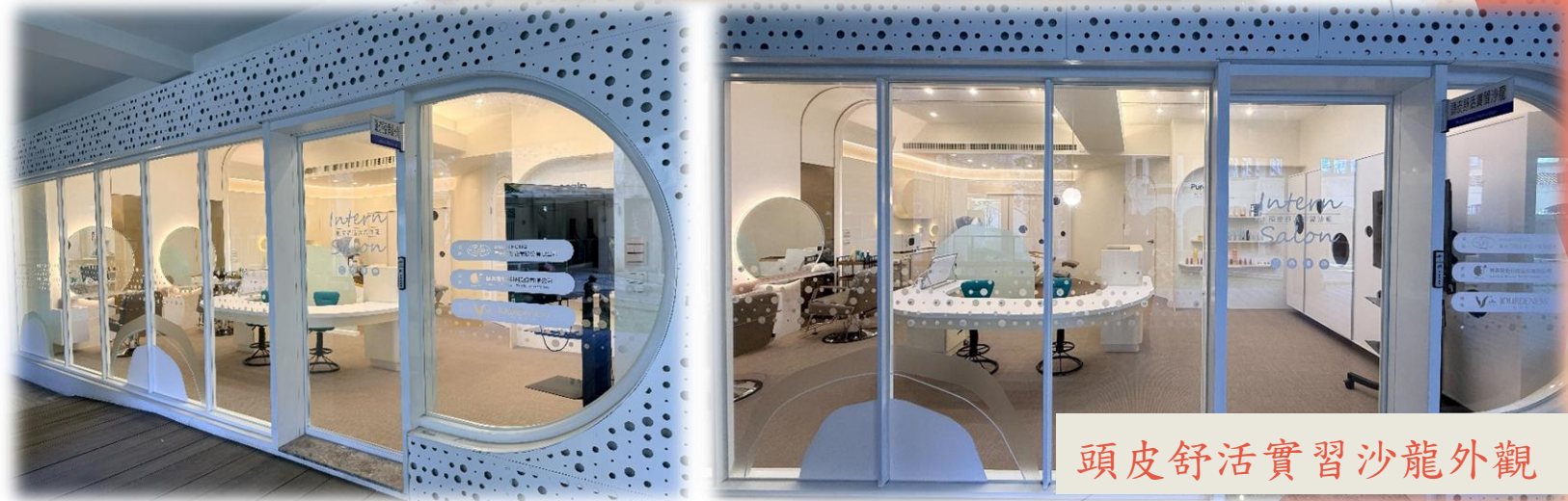
頭皮舒活實習沙龍外觀