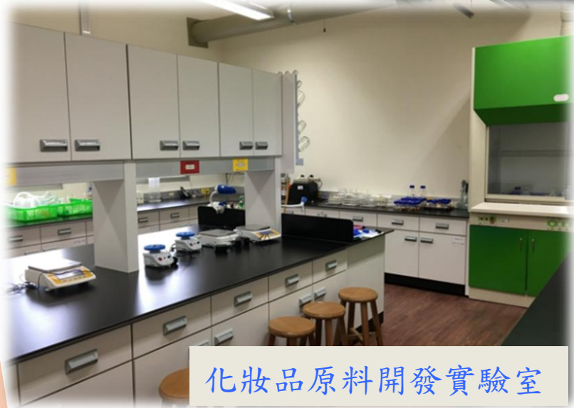
化妝品原料開發實驗室