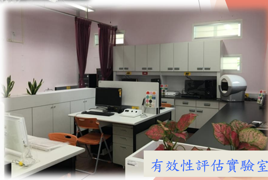
有效性評估實驗室