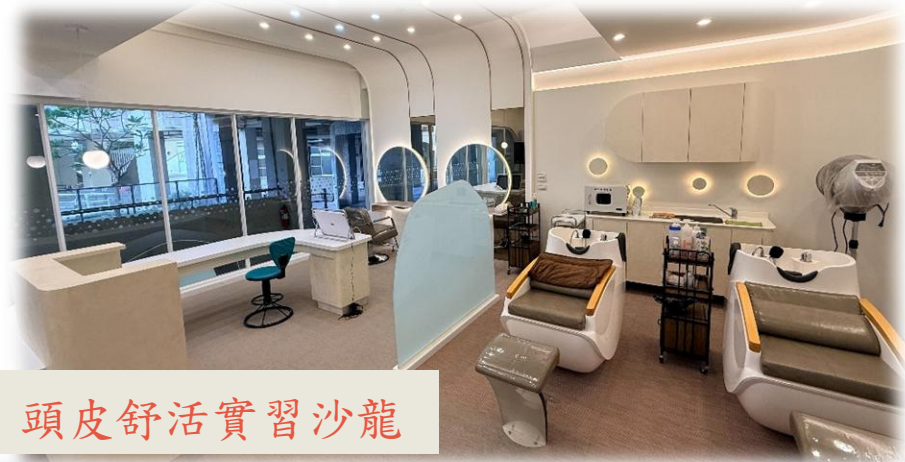
頭皮舒活實習沙龍